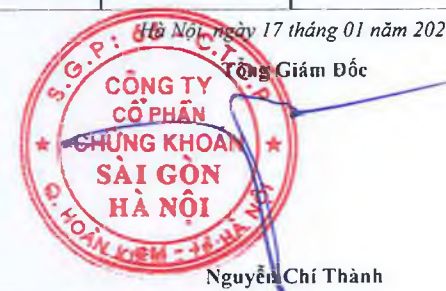
Nguyễn Chí Thành